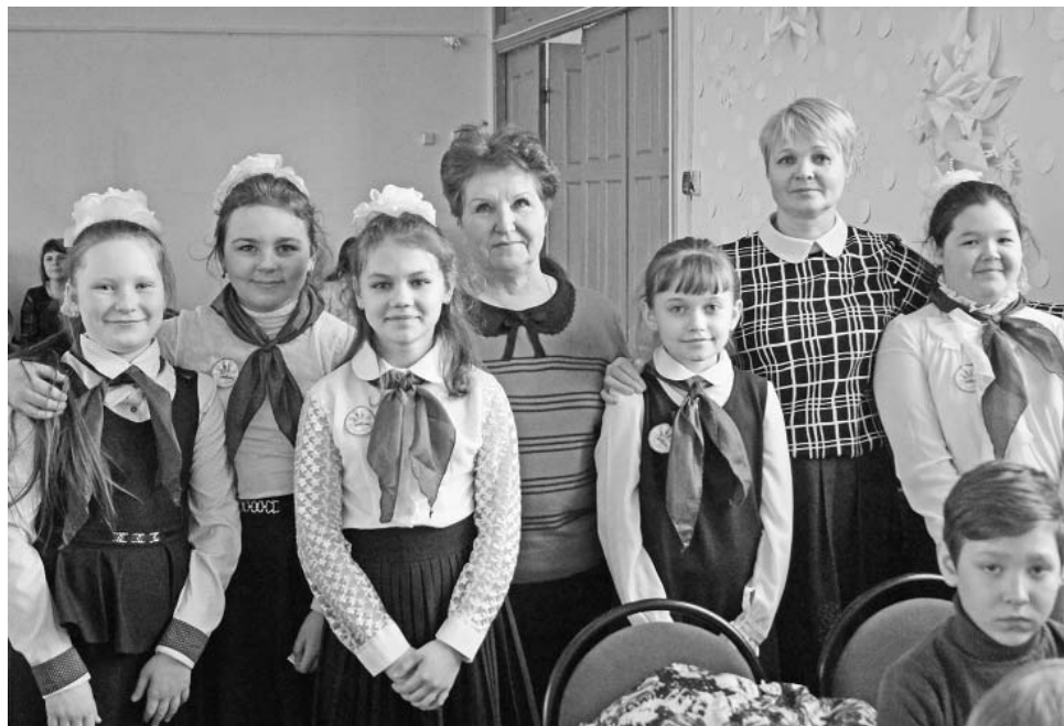
Участницы игры из Новослободска со своими педагогами.