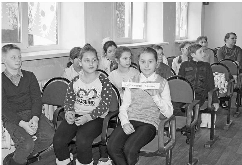
Команда «Пасхальный благовест».